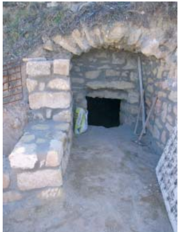
Entrada lateral de la Nevera

El comercio de nieve en la localidad, durante la segunda mitad del siglo XVIII y el primer tercio del siglo XIX, se encontraba perfectamente organizado, tal como se demuestra en los arriendos del abasto realizados por el Ayuntamiento y Junta de Propios en los años 1761 y 1765, durante los cuales la nieve tuvo que comprarse fuera por carecer de ella en la población. En esos años de escasez, la nieve se adquiría, habitualmente, en los puertos de Peñarroya. Algún tiempo después, la provisión de nieve se concertaba con el arrendatario del molino de aceite comunal en una cláusula específica, que fue incluida en los arriendos realizados entre 1791 y 1817. En ella, el Ayuntamiento le cedía la nevera para su posible utilización, debiendo entregarse a cada comprador el doble de nieve, si ésta había sido recogida en el pueblo. En julio de 1832, el consistorio local acordaba su provisión durante dos meses, a tres dineros la libra, siendo la última noticia conocida sobre el suministro de nieve a la población.