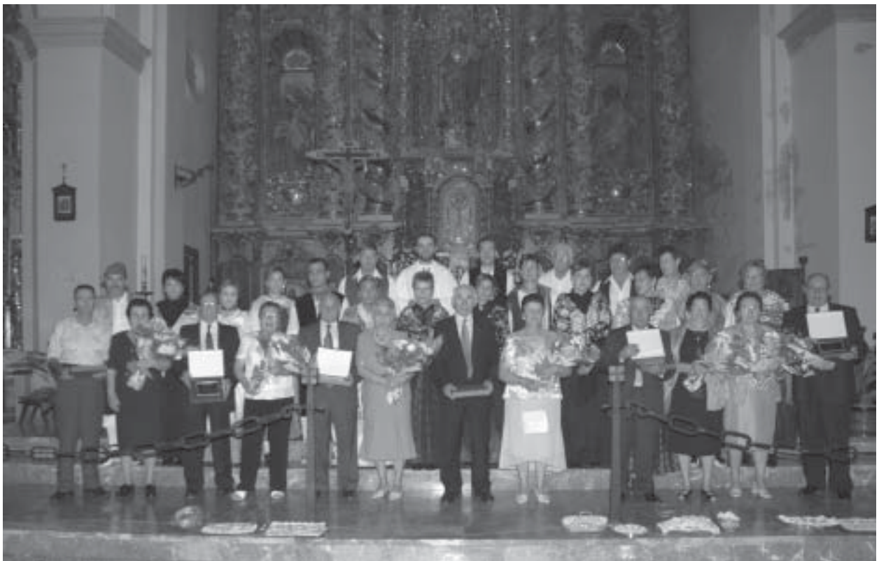
Homenaje a los matrimonios que han cumplido las Bodas de Oro en 2006