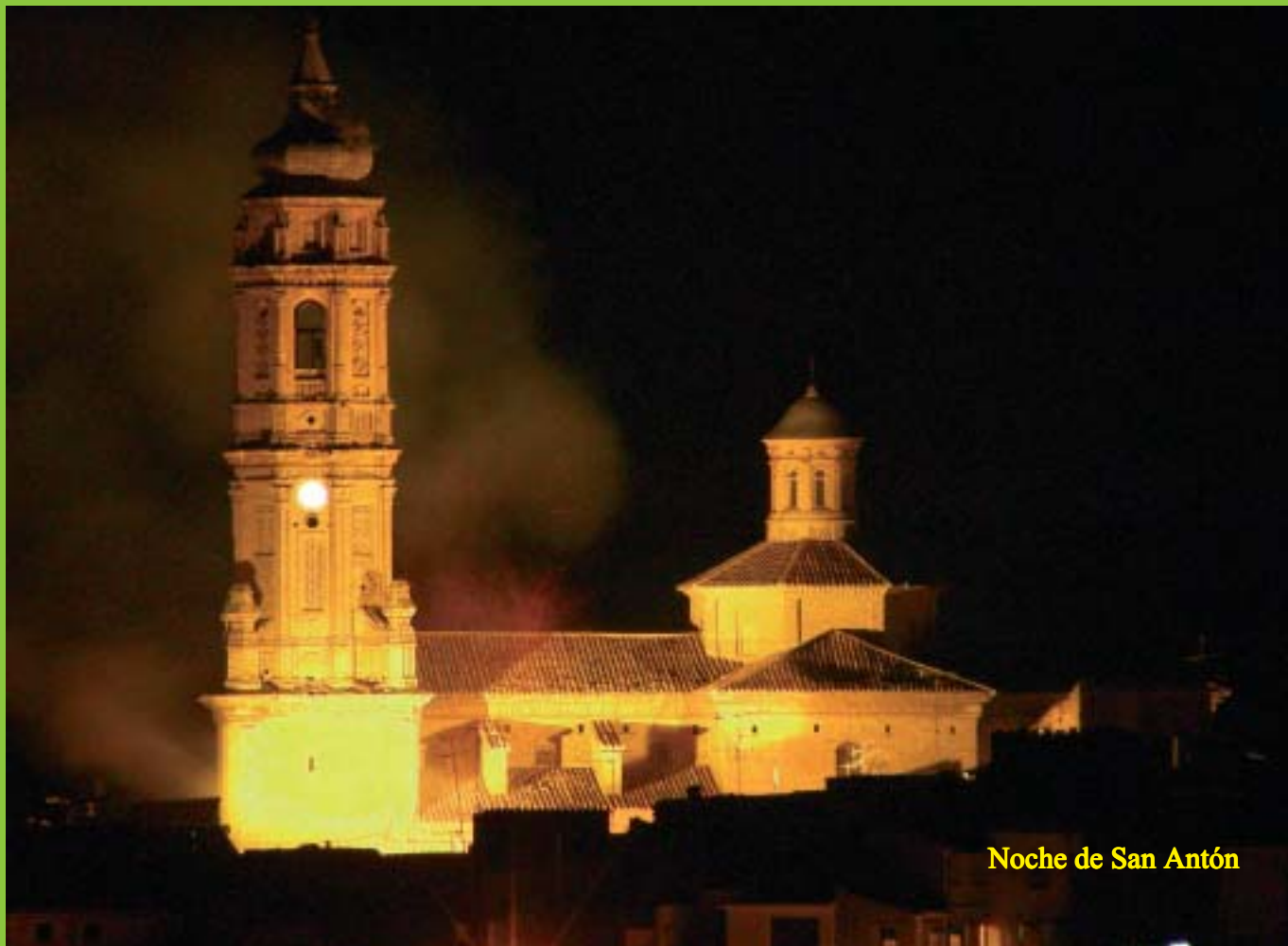
Noche de San Antón