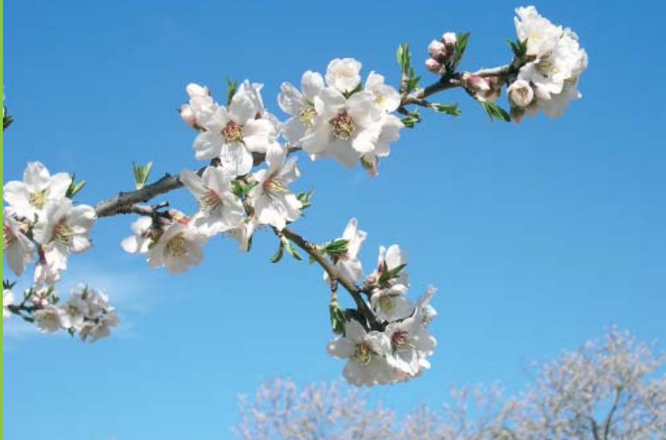
Almendros en flor