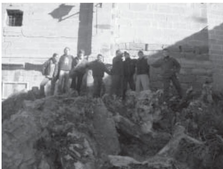
Algunos de los Quintos del 2003