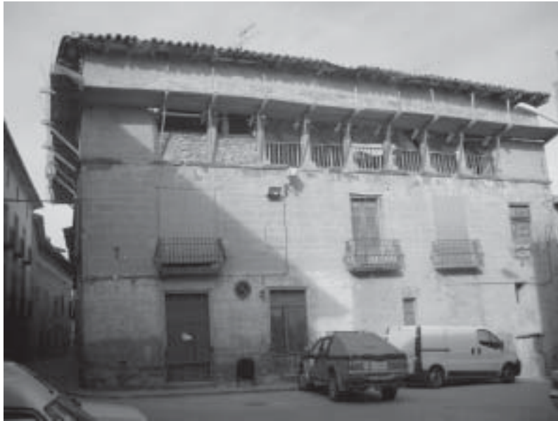
Protección instalada en la Casa del Barón de Andilla

Como último punto en la Orden del Día se da paso a ruegos y preguntas, formulándose una acerca de la necesidad de contratar una póliza de seguros que cubra los posibles daños causados por los toros de fuego de las fiestas. Estimándose necesaria su contratación, se aprueba por unanimidad. Y no habiendo más asuntos que tratar se levanta la sesión a las veintiuna treinta horas.