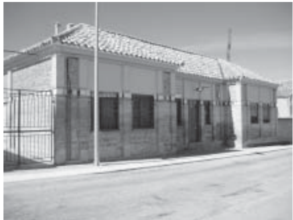
Imagen de las Escuelas Públicas en la actualidad

Aprovechando las vacaciones escolares navideñas se ha continuado realizando mejoras en las instalaciones de las Escuelas Públicas. Después del pintado general que se realizó en el mes de Agosto, se ha procedido a la sustitución de la caldera de la calefacción ya que sufrió una grave avería. De la misma forma se han sustituido también los tubos de la chimenea tratando de dejar la instalación de la forma más adecuada posible. Continuando con esta mejoras se prevé que para este año se instalen unas vallas de protección en la salida principal que da a la carretera y se tiene previsto arreglar la cubierta del patio interior que se encuentra desde hace años en mal estado.