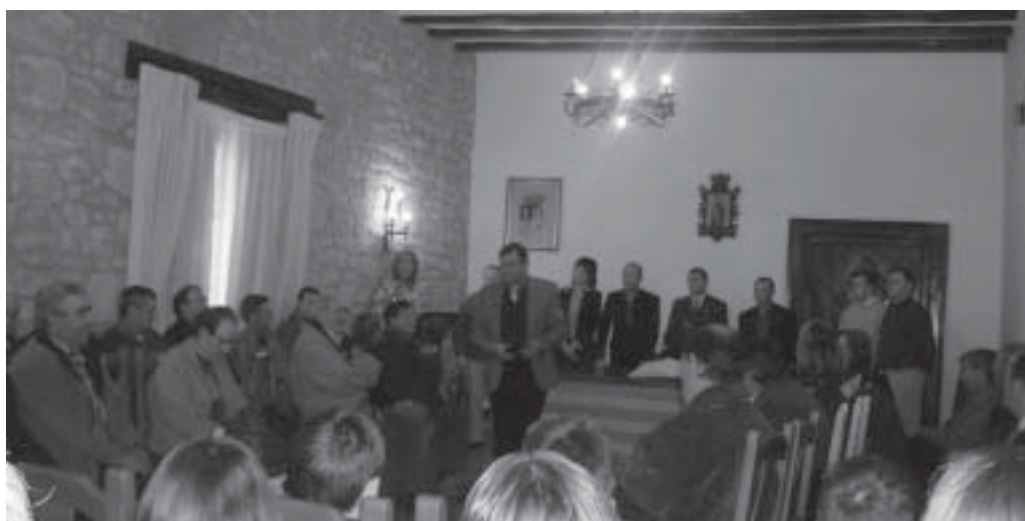
Uno de los momentos del Acto de reconocimiento.

Tras este apartado, la actual Corporación hizo entrega a los invitados de una placa de plata que rezaba así : «Excmo.. Ayuntamiento de Valdealgorfa. 25 años con la Constitución. 6 de Diciembre de 2003.». El acto concluyó con unas palabras del actual Alcalde, invitándose a continuación a un aperitivo abierto para todo el pueblo.