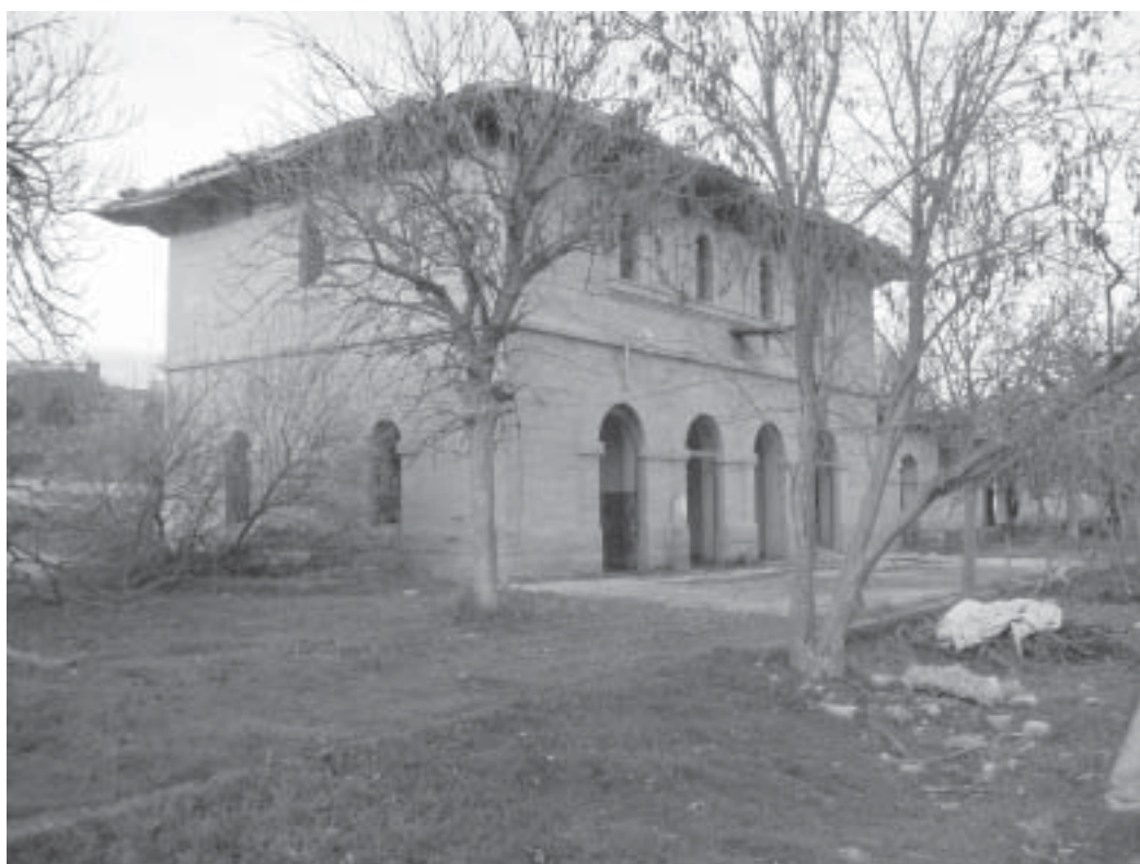
Actual estado de la Estación de Valdealgorfa

Tras realizar el Alcalde una breve exposición de los motivos que provocaron la no adhesión a este Consorcio por parte del anterior consistorio, cede la palabra al Concejal de Turismo y Medio Ambiente a fin de exponer y argumentar las ventajas que puede suponer la incorporación del mencionado tramo a este proyecto de turismo medioambiental, incidiendo en lo positivo que sería ser punto de inicio de este recorrido. Tras un debate entre los ediles y ante el argumento de que desde la Administración solicitan ya una clara definición de la postura municipal, se deja constancia de que se intentarán crear las menores molestias posibles a los vecinos que utilizan este tramo, tratando de crear y adecuar rutas alternativas. Tras votar este punto se resuelve la votación con cuatro votos a favor de la adhesión y tres abstenciones. En consecuencia se acuerda la adhesión al Consorcio de la Vía Verde en el tramo Estación de Valdealgorfa - Límite término de Valjunquera . Igualmente se acuerda remitir el presente acuerdo al Dtor. Gral. de Transportes del Gobierno de Aragón y al Pte. de la Comarca del Matarranya.