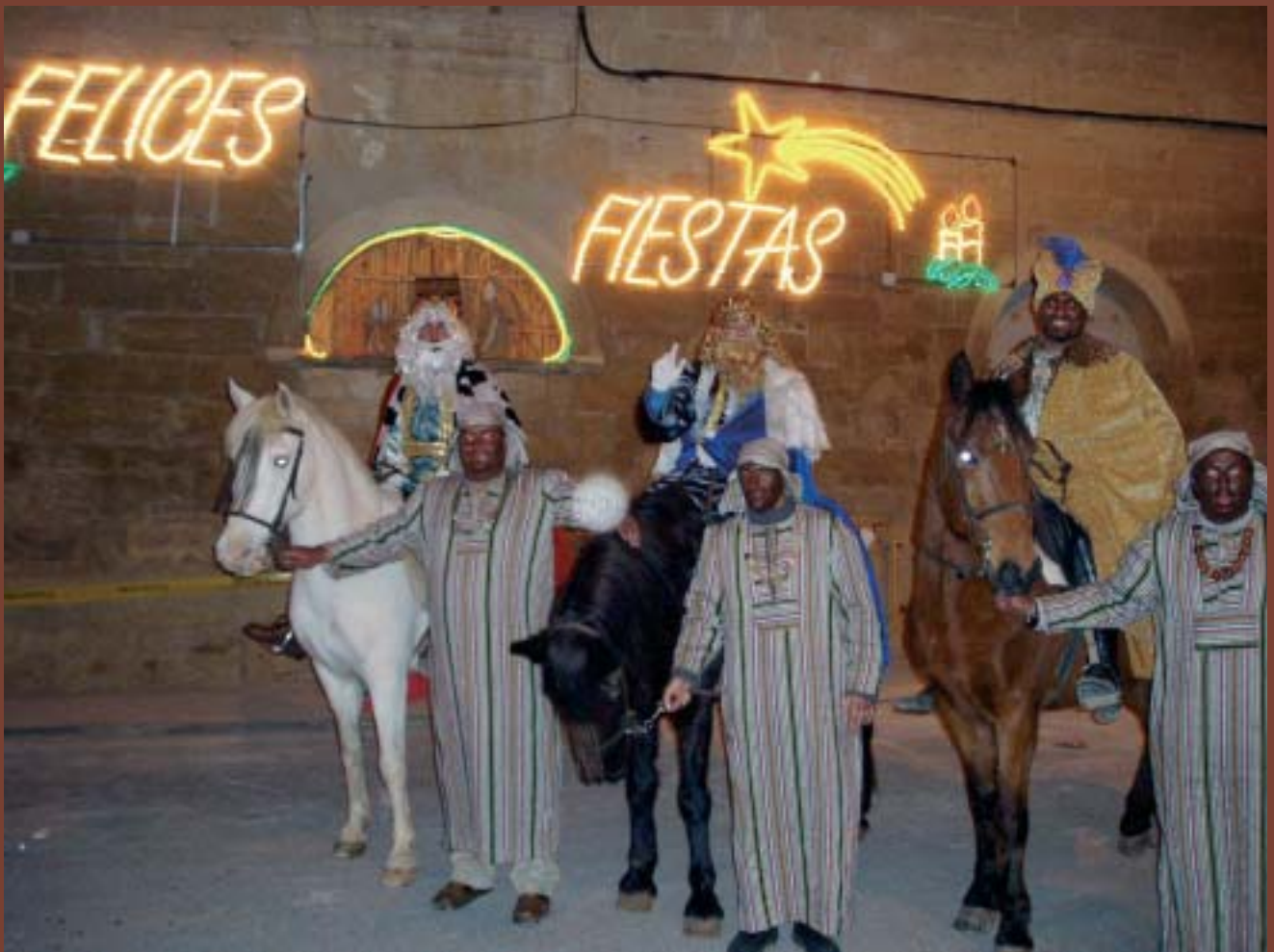
SS. MM. Los Reyes Magos de Oriente en su visita a Valdealgorfa