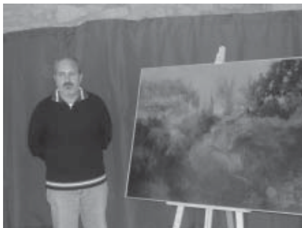
Primer Premio de Pintura