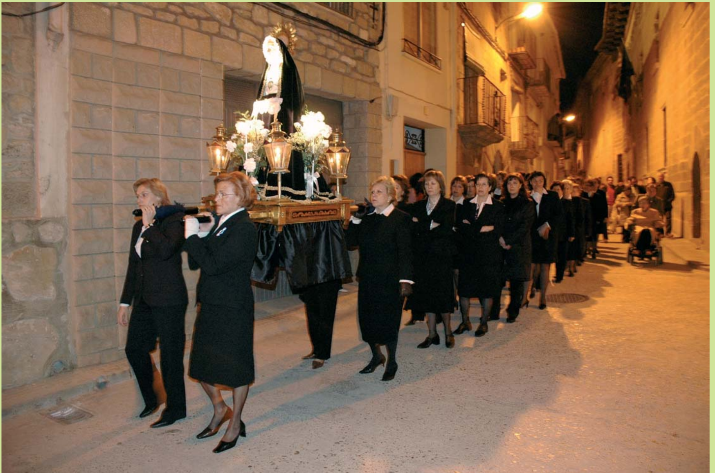
Semana Santa 2005