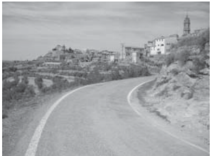
En el Convenio se prevé realizar el colector de aguas residuales de la margen izquierda de Valdealgorfa.