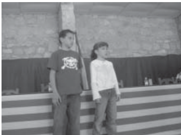
Premiados categoría infantil y juvenil de relatos cortos

Concluida la entrega de premios del concurso de relatos cortos «Salvador Pardo Sastrón» en honor a este importante escritor local especialmente por su obra de finales