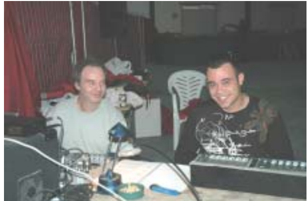
Los técnicos de sonido disfrutaron de lo lindo.