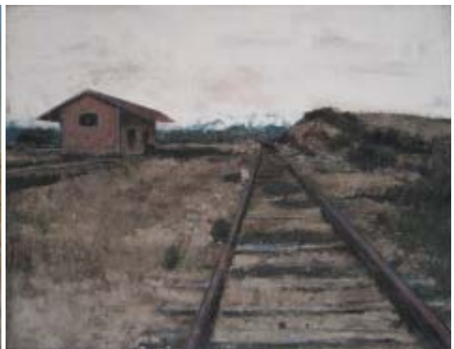
1 er Premio de la categoría general.