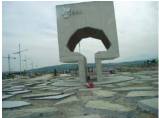
Entrada del futuro Parque Geolit

Málaga, para visitar sendos parques relacionados con el proyecto existente en Valdealgorfa de creación de un parque tecnalimentario. En Jaén se visitó el Parque Científico-Tecnológico del Aceite del Olivar (Geolit), y en Vélez Málaga se mantuvieron reuniones con representantes del Ayuntamiento acerca del parque que en estos momentos se está desarrollando allí. La conclusión del Sr. Alcalde-Presidente es que el viaje realizado fue muy interesante ya que se pudo conocer la problemática de los parques, con la finalidad de desarrollar el proyecto de parque agroalimentario en Valdealgorfa, tanto para conocer problemas burocráticos, como de urbanismo, de implicación de instituciones, de tiempo etc. Posteriormente el Alcalde mantuvo una reunión con un técnico de la Oficina de Transferencia de Resultado de Investigación que pertenece a la Universidad de Zaragoza, que ofreció la colaboración de dicha Institución para la puesta en marcha del parque agroalimentario de Valdealgorfa.