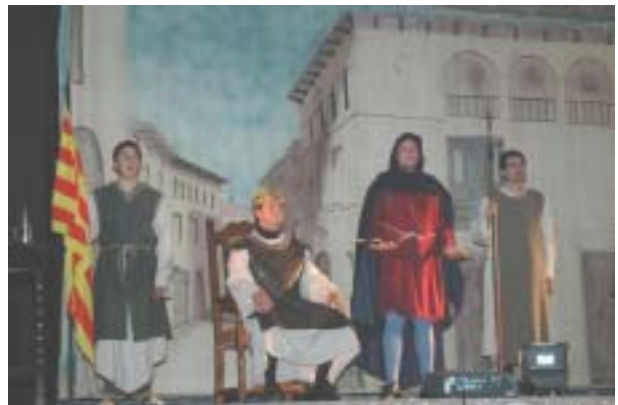
El Rey de Aragón.