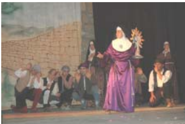
Santa Clara en acción.