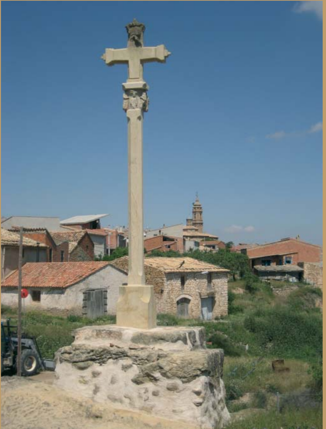
Cruz del Abarquillo