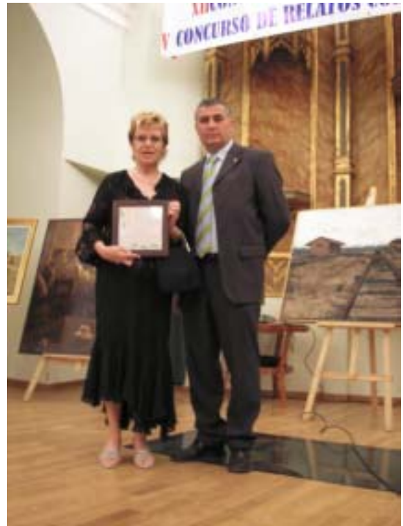
Entrega de premios a las Asociaciones