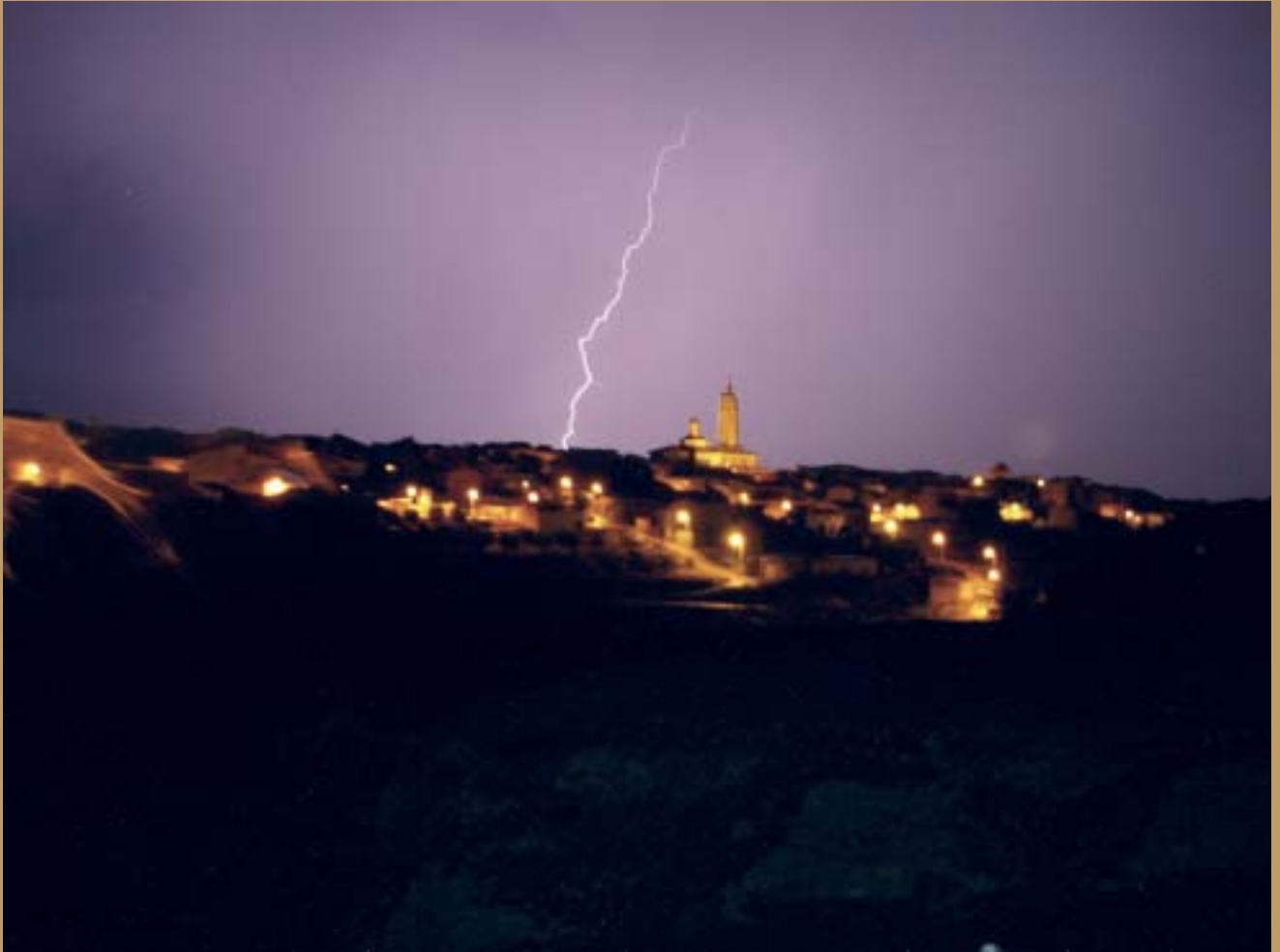
Tormenta de verano